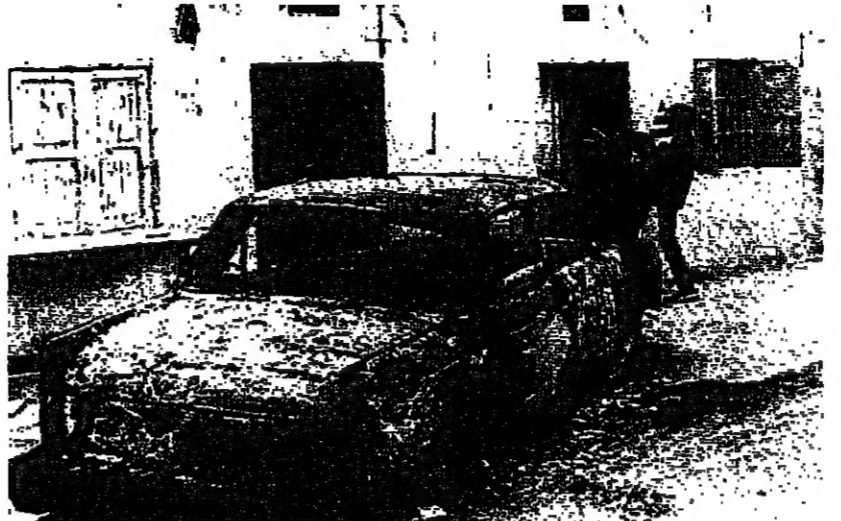
موقع حرق درب السيم في بلدة درب السيم